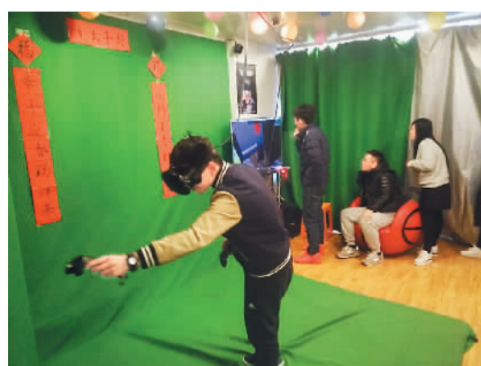
顾客在VR视界虚拟现实主题乐园体验VR世界。

杨蒙福认为，创业一定会遇到种种困难。“我参加过很多活动，也认识了很多创业者，每个人都有自己的梦想，每个人都有自己的独特想法，但他们都有一个共同特点就是做好了充分的心理和财务准备。”理想与现实永远存在差距，所以在创业过程中，一定要计划好每一步，把每一步落到实处。“其实我并不是很建议尚未毕业或者刚刚毕业的大学生去创业。作为一个公司的创始人，创业初期往往要一人身兼数职。我体会到，创业除了对知识、经验与人脉方面有一定的要求，更需要一股韧劲和拼搏精神。而这往往是没有工作经历的人所欠缺的。”杨蒙福如是说。