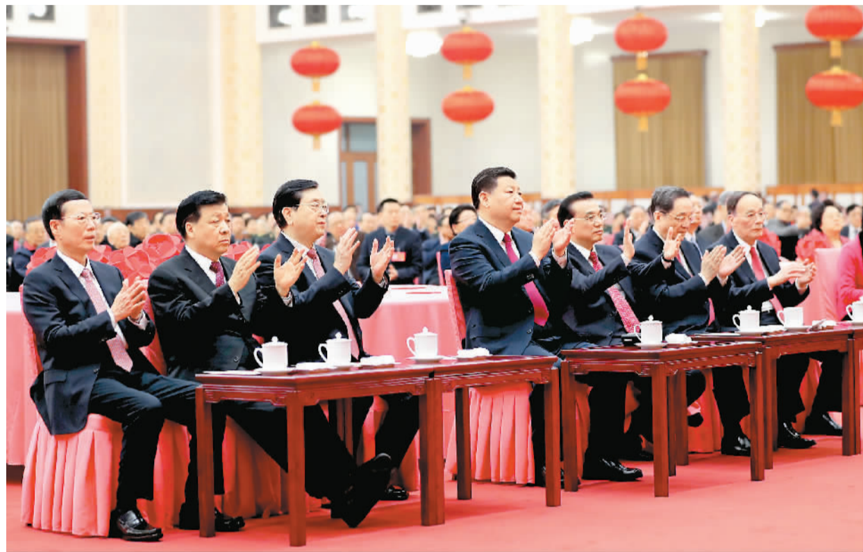
▲ 中共中央总书记、国家主席、中央军委主席习近平在2017年春节团拜会上发表重要讲话。 ▲ 党和国家领导人习近平、李克强、张德江、俞正声、刘云山、王岐山、张高丽等同首都各界人士欢聚一堂，共迎新春。

本报北京1月26日电 中共中央、国务院26日上午在人民大会堂举行2017年春节团拜会。中共中央总书记、国家主席、中央军委主席习近平发表重要讲话，代表党中央、国务院，向全国各族人民、向香港特别行政区同胞、澳门特别行政区同胞、台湾同胞和海外侨胞拜年。