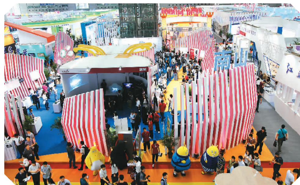
第十二届文博会主场馆