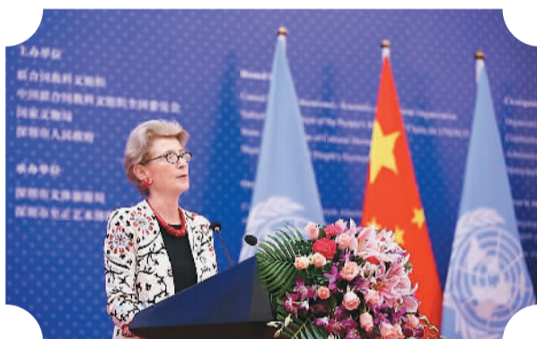
国际博物馆高级别论坛

论坛由联合国教科文组织、中国联合国教科文组织全国委员会、国家文物局、深圳市政府共同主办。世界多国文化部长、博物馆馆长和专家代表齐聚深圳，论坛同时发布了《深圳宣言》，在国内外产生深刻影响。