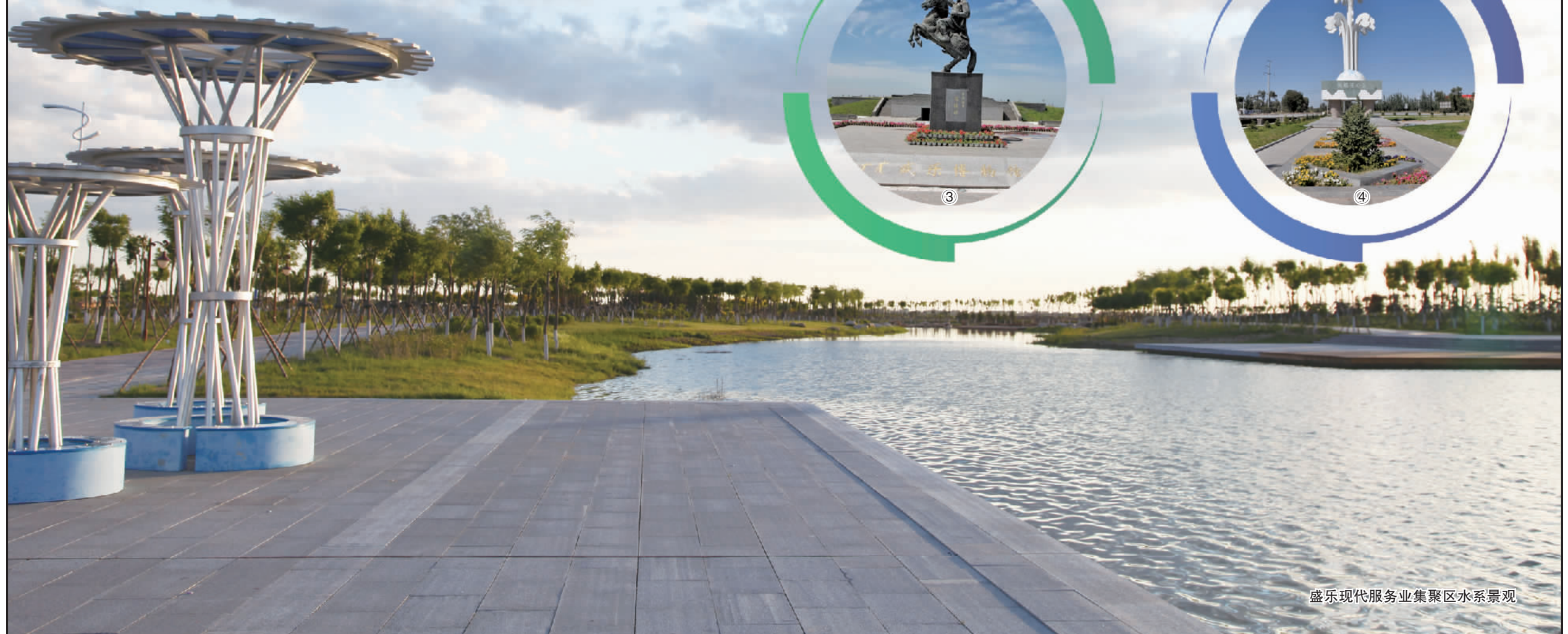
盛乐现代服务业集聚区水系景观