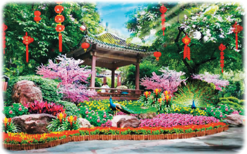
风光旖旎的越秀公园

不问君自何方来，只道岭南花常开。在这个农历新年里，广州以海纳百川的胸怀，美不胜收的春色让你陶醉在温馨无边花海。