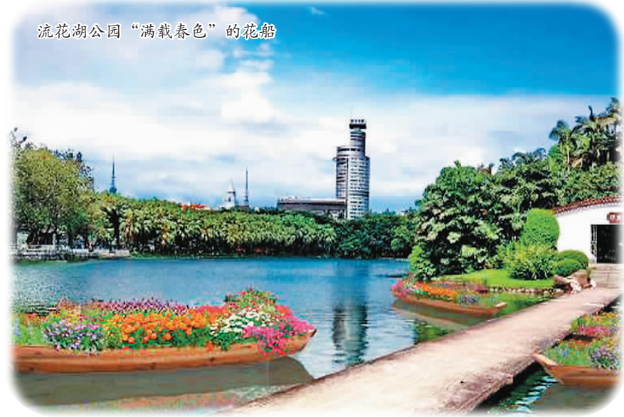
流花湖公园“满载春色”的花船