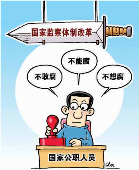
“利剑”高悬 徐 骏作

事实上，试点省份已就此进行了多方面准备。例如在山西，之前已经举办全省深化监察体制改革