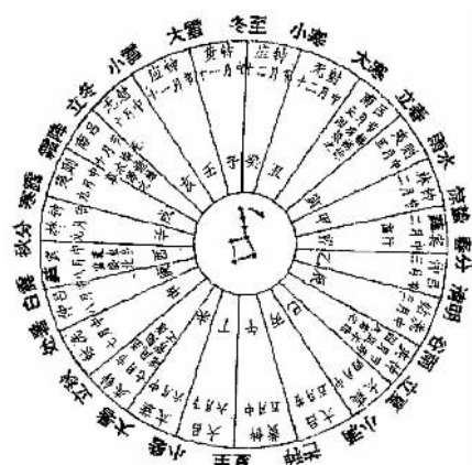
《淮南子》二十四节气图

中国二十四节气的研制，经过了漫长的岁月。 早在《尚书·虞书·尧典》中就记载：“日中，星鸟，以殷仲春。日永，星火，以正仲夏。宵中，星虚，以殷仲秋。日短，星昴，以正仲冬。”日中，指春分。日永，指夏至。宵中，指秋分。日短，指冬至。《左传·昭公十七年》载：“玄鸟氏，司分者也；伯赵氏，司至者也；青鸟氏，司启者也；丹鸟氏，司闭者也。”用玄鸟、伯赵、青鸟、丹鸟，代表四季。《吕氏春秋》中有立春、日夜分（春分）、立夏、日长至（夏至）、立秋、日夜分（秋分）、立冬、日短至（冬至）、雨水、白露等10个节气。先秦时期，诸侯混战，天下动乱，科研条件有限，二十四节气的体系和名称尚未确立，属于前期研究阶段。 汉朝的建立，结束了长期的战乱局面，天下安定，经济恢复，文化繁荣，学术发展，百家争鸣。在这样的条件之下，二十四节气的研究，才能得以进