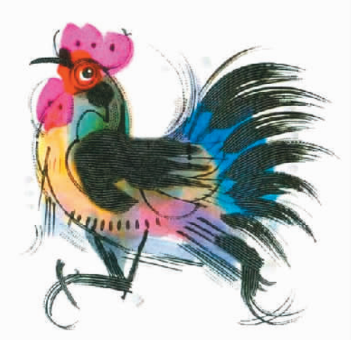
中国邮政发行的《丁酉年》生肖特种邮票中鸡的形象之一，由韩美林创作

“雞”字收在《说文解字》隹部中，许慎解释为：“知时畜也。从隹，奚声。”“知时畜”是指鸡具有应时而鸣的生物特性，这里显然指的是报晓司晨的公鸡，而非下蛋的母鸡。许慎并注明其籀文从鸟，即写作“鷄”。关于“鸟”，《说文》释为“长尾禽总名也”，与“隹”为短尾鸟大异。小篆、隶书又恢复写作“雞”。楷书则出现了“雞”和“鷄”两种写法。简化字取“鷄”字，将左部的声符“奚”简化为“又”，右部“鳥”简化为“鸟”，这就是现在通行的简体字“鸡”的由来。 “鸡”在字形演变中出现了“雞”“鷄”两种繁体写法，其义符分别为“隹”和“鸟”。清代桂馥《义证》称：“隹、鸟异类，短尾为隹，长尾为鸟。”这里就出现了一个非常有趣的文字现象：鸡究竟属于长尾鸟还是短尾鸟？动物学家称，鸡属鸟纲雉科家禽，翅膀短。然而，有些品种的公鸡尾羽又长又美，甲骨卜辞中许多“鸡”字皆高冠修尾。因此有人认为，长尾的“鸟”指公鸡，短尾的“隹”指母鸡，此说颇有点类似英语中动物的性别名词，如cock（公鸡）和hen（母鸡）。还有一种说法认为这反映了古人对鸡的认知出现了混乱。不过本人根据雉鸡的尾羽比家鸡长很多，而“稚”字从“隹”；同时参考“鸡”的文字发生学依据，其正体字应为“雞”，因此鸡当属于短尾鸟。但简