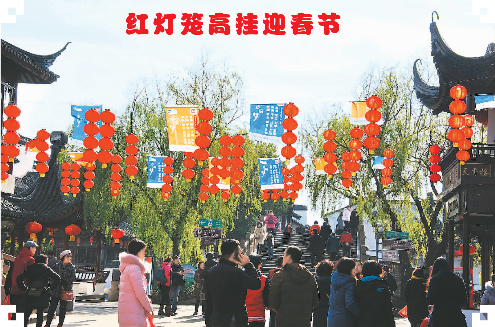
1月23日，春节将至，上海七宝古镇老街已红灯笼高挂，迎接春节，洋溢着节日的喜庆气氛。

据新华社济南1月23日电 2017年1月23日，山东省济南市中级人民法院对第十二届全国政协原副主席苏荣受贿、滥用职权、巨额财产来源不明案一审公开宣判，对被告人苏荣以受贿罪判处有期徒刑，剥夺政治权利终身，并处没收个人全部财产；以滥用职权罪判处有期徒刑七年；以巨额财产来源不明罪判处有期徒刑七年，决定执行有期徒刑终身，并处没收个人全部财产。苏荣当庭表示服从法院判决，不上诉。 经审理查明：2002年至2014年，被告人苏荣利用职务上的便利，为他人企业经营、职务晋升调整等事项上谋取利益，本人直接或通过他人收受相关单位和财物折合人民币1.16亿余元；滥用职权，致使公共财产、国家和人民利益遭受重大损失；苏荣对共计折合人民币8027万余元的财产不能说明来源。