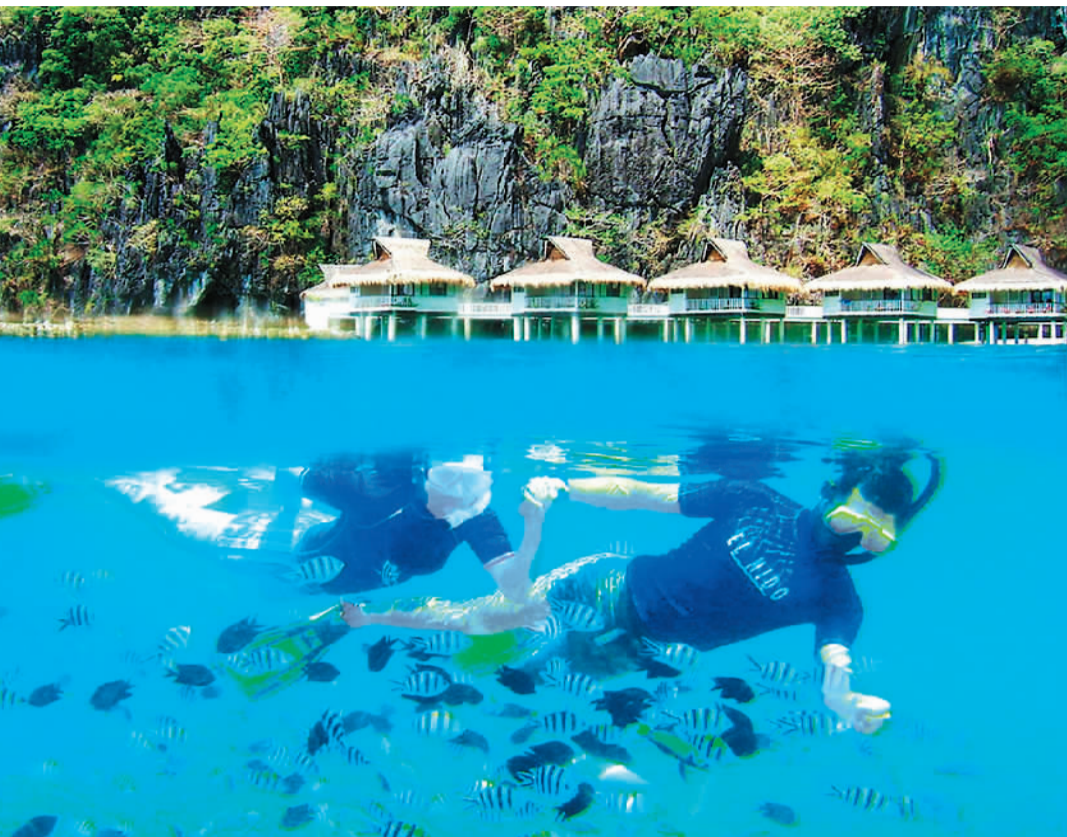
菲律宾海岛游

据新西兰奥克兰理工大学新西兰旅游研究所的孙明辉博士介绍,新西兰夏天无酷暑,天气非常舒适。春节期间,新西兰将迎来中国游客的高峰,酒店常会出现爆满的情况。