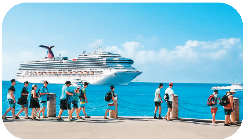
从码头远眺嘉年华邮轮“荣耀号”

年逾古稀,奔命式的跟团旅游已不太适应。邮轮旅游是较为轻松、自由的休闲旅游,并已成为当下日渐流行的出游方式,也是老年出游的首选。