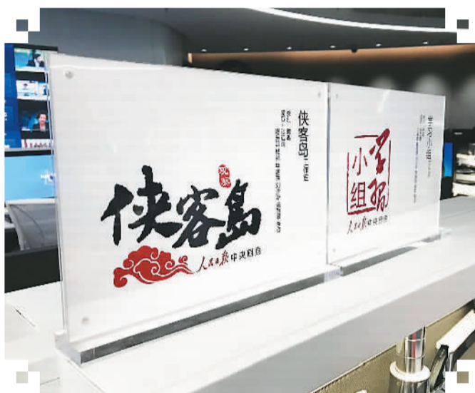
图为人民日报“中央厨房”现场

人民日报社顺势建立的“中央厨房”,正是在媒体融合的道路上为党的舆论宣传树立了新的标杆。人民日报社社长杨振武认为,“中央厨房”在人民日报的融合发展史上具有里程碑意义,其运行“开启了人民日报融合发展的新征程”。