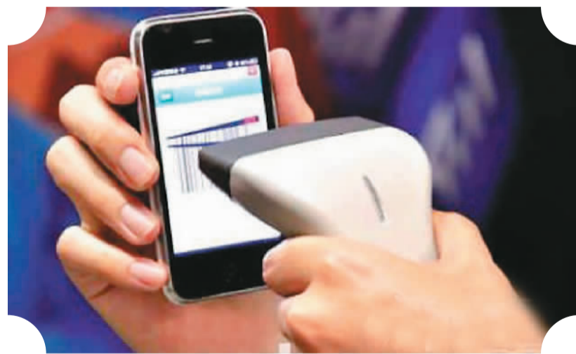
图为二维码支付

等待远处的少女峰亮起星星,山谷缓坡的房舍亮起灯光,我坐上返回因特拉肯的末班列车,带着些许遗憾与不舍离开,期待着再一次的邂逅。