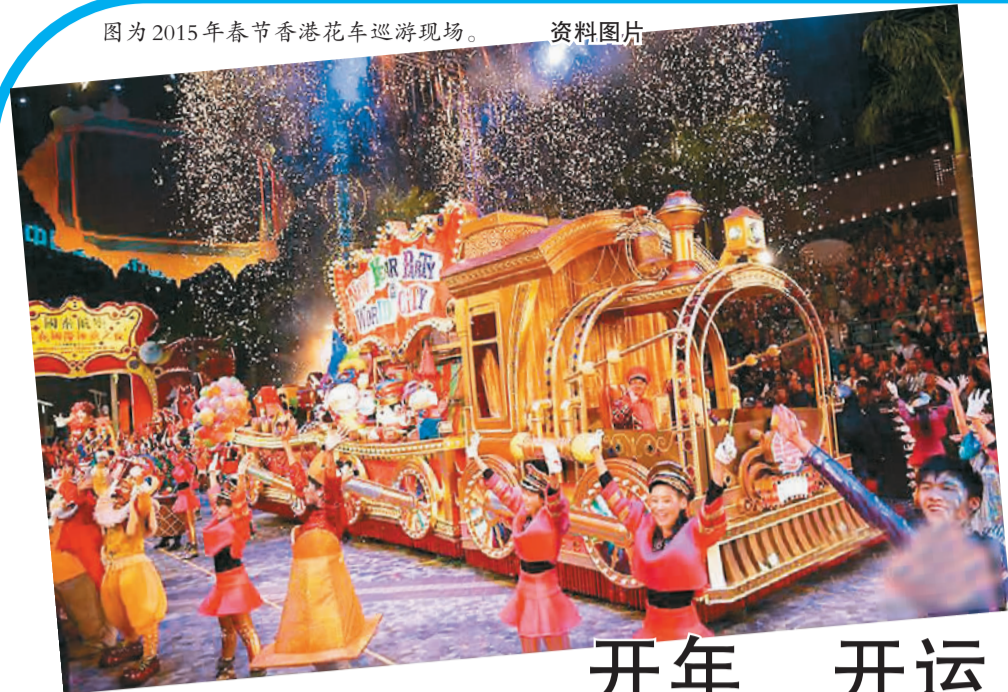
图为2015年春节香港花车巡游现场。 资料图片