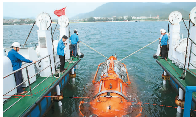
1月19日至20日, 海南省海事局在三亚市举行了中国首次民用载客潜水器操作员考试, 此项考试将为推进中国民用潜水器的产业化发展提供有力支持。