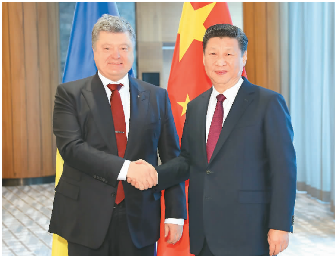
一月十七日，国家主席习近平在瑞士达沃斯会见乌克兰总统波罗申科。