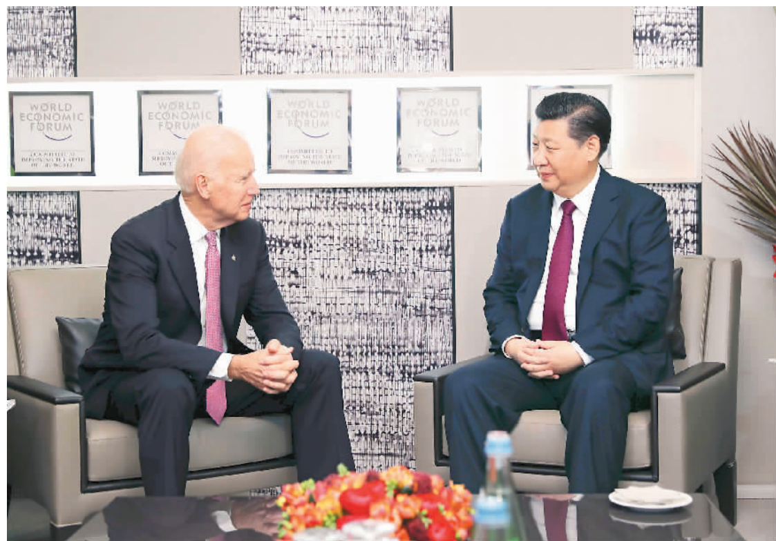
一月十七日，国家主席习近平在瑞士达沃斯会见美国副总统拜登。