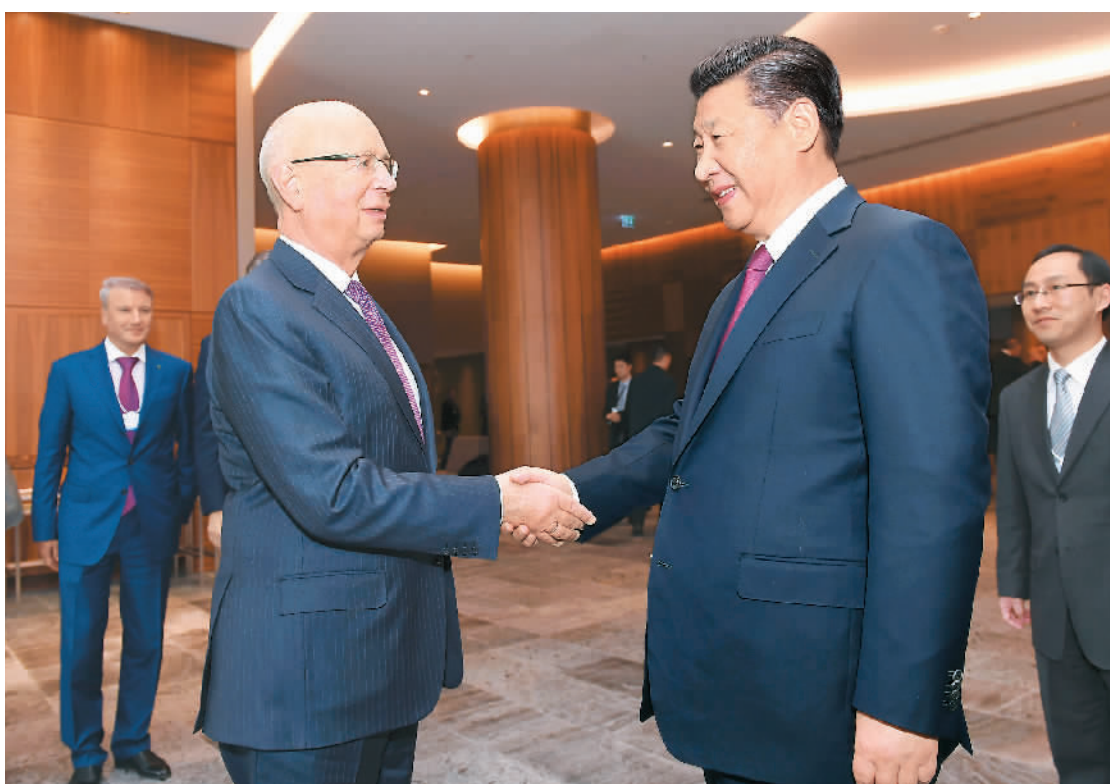
一月十七日，国家主席习近平在瑞士达沃斯会见世界经济论坛主席施瓦布。

本报瑞士达沃斯1月17日电（记者杜尚泽、吴刚）17日，国家主席习近平在达沃斯会见世界经济论坛主席施瓦布。习近平强调，世界经济论坛自创建以来秉持创新精神，保持发展活力，推动探讨解决各类全球性问题，地位和影响力与日俱增，论坛年会已经成为“世界经济风向标”。今年论坛年会主题紧扣当前国际形势，指出了世界走出困境的关键。我们要共同对外释放积极信号，增强大家对世界经济全球化进程的信心。习近平指出，当前，中国同世界经济论坛合作的内