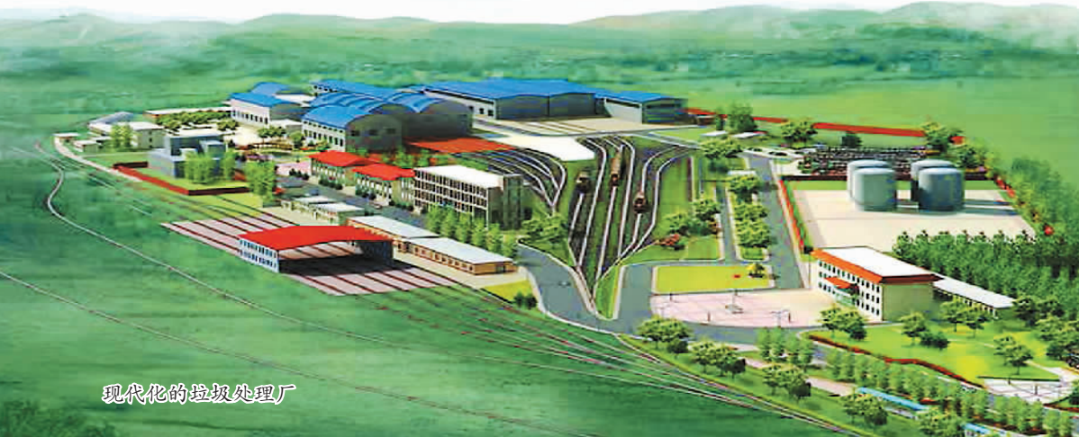
现代化的垃圾处理厂

入桶、垃圾集中处理两大农村卫生工程。采用“村收、镇运、县处理”三级处理体系，在村内配备垃圾箱，垃圾车定时拉走，统一运送到镇里，经中转站压缩打包后，到城里进行无公害化处理。