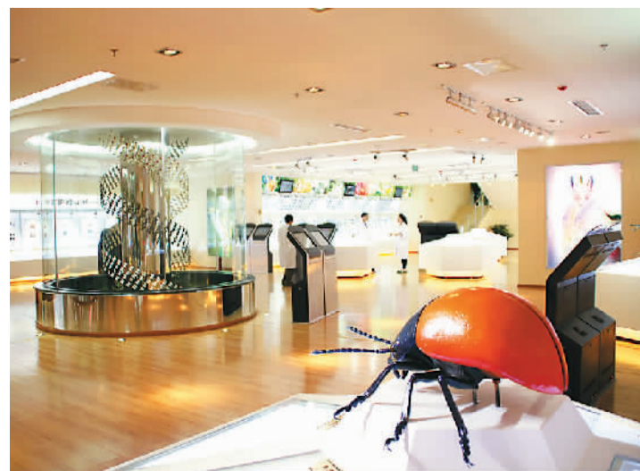
华希昆虫博物馆展厅一角

华希昆虫博物馆有着众多“之最”，比如亚洲最大博物馆、70余项昆虫世界之最、全球收藏中国蝴蝶种类最齐全博物馆，等等。