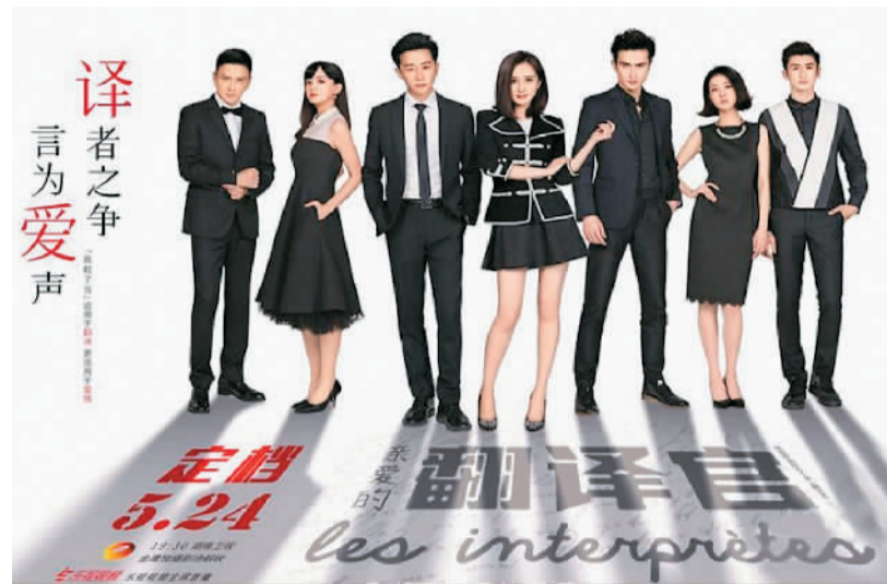
2016年在网络和电视台都热播的剧集《亲爱的翻译官》

观，网络剧的吸引力在于牵引着受众对精神世界的驰骋和向往，而不是对搏出位元素的贩售和叫卖。例如网络热播剧《最好的我们》，就用温暖而明媚的叙事话语，向观众展示了青春校园的美好之处。2016年，规范网络视频内容的规则与条款相继出台，在定位内容尺度坐标的同时，将激发对内容和创意的深度开发，探索出真正有益于网络剧集受众的作品与内容。