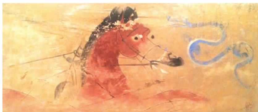
轺车龙马图 乌审旗巴日松古教包M2前室西壁(东汉) 姚智泉摹制

宫、北京法海寺、内蒙古阿尔寨石窟以及鄂尔多斯地区部分汉代墓室壁画。其中，以北京故宫博物院梵华楼藏原图制作的一幅护法图，长20米，高3米，是国内现今最大的唐卡样式的护法图。