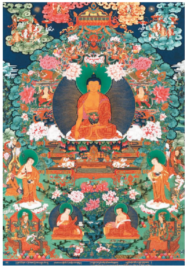
释迦牟尼 塔杰桑布

近年来，西藏大力实施文化强区战略，西藏特有的文化得到进一步传承和发展，并被更多世人熟知。被列为世界非物质文化遗产的唐卡就是其中之一。