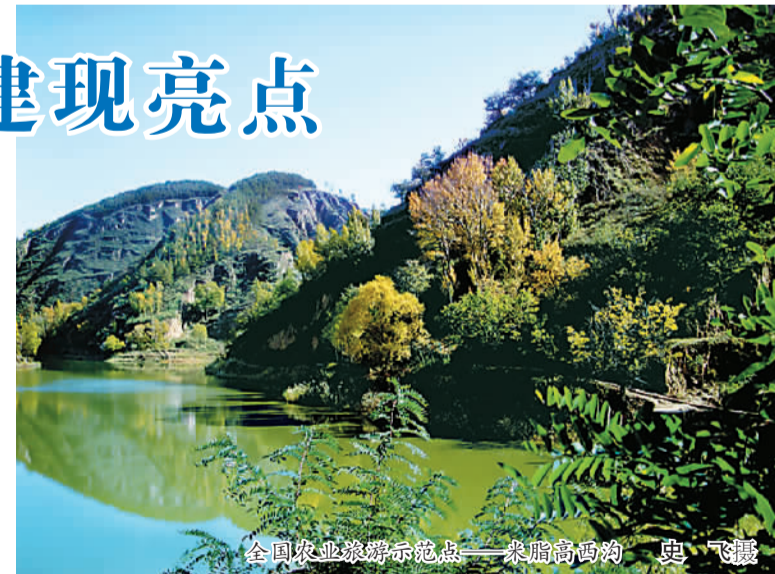
全国农业旅游示范点——米脂高西沟

石沟镇是米脂县的一个大镇,人多地广。该镇党委抓住镇村改革的有利时机,及早开展撤村并村改革工作,是全县撤村并支到位的一个乡镇。如何适应村级组织设置发生的新变化,镇村两级党组织深入思考,在广泛征求群众意见的基础上,提出了以土地流转为引擎,大力发展以山地苹果为主导的现代农业,打造集中连片山地苹果产业党建示范集群。该镇以官道山、任坪、宋山、郝家兴庄和党坪等5个村撤并后组建起来新的行政村党坪村,流转2000多亩土地栽种苹果,并对原撤并的官道山村103户群众进行移民搬迁,让他们住进了新房;以党塔、艾好湾、盘草沟整合2500亩土地发展苹果产业。同时,为了让群众懂管理、会经营,村党支部办起了农业技术培训中心,定期组织培训。