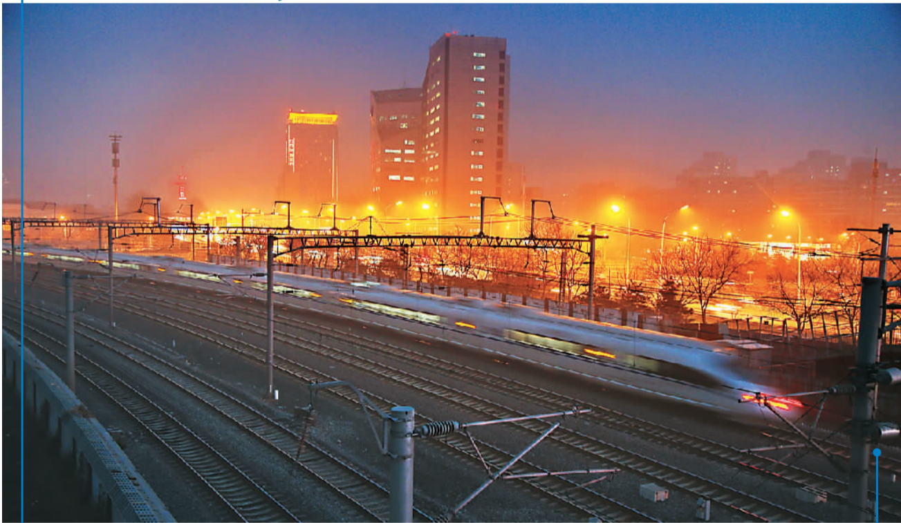
在春运到来之前，自1月5日起全国铁路将实行新的列车运行图，增开旅客列车135对。运行图调整后，全国铁路开行旅客列车总数达3570.5对，其中动车组列车2332.5对。图为一列动车组列车驶出北京南站。