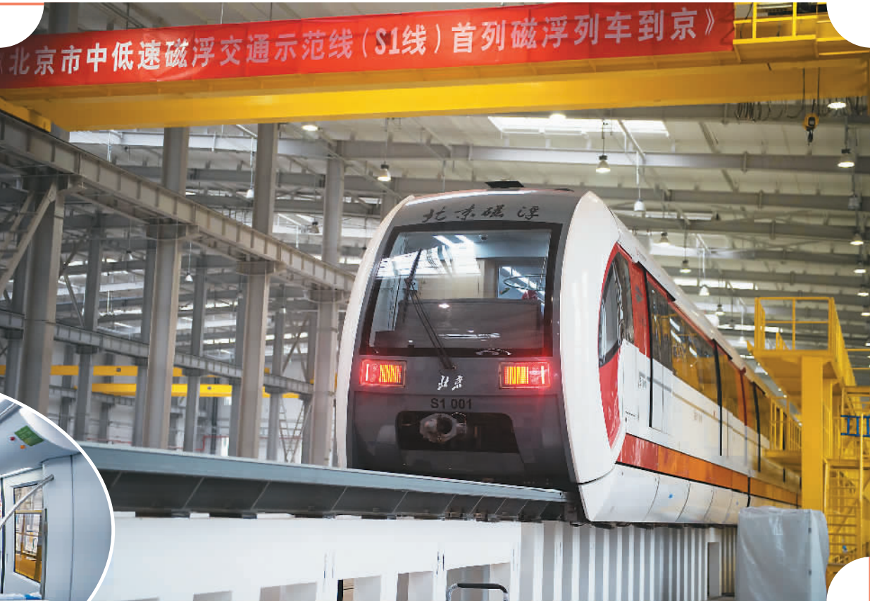
大图为停放在北京S1线石门营车辆段的北京S1线首列磁浮列车。小图为北京S1线首列磁浮列车车厢内部。

北京市中低速磁浮交通示范线（S1线）首列磁浮列车日前进京到达S1线石门营车辆段，之后将会启动列车调试，预计将在2017年实现载客运行。 S1线是北京市首条磁浮线，西起门头沟区的石门营站，东至石景山区的苹果园站。