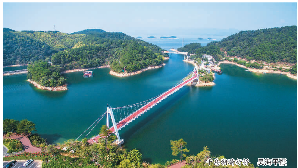
千岛湖骑行绿道