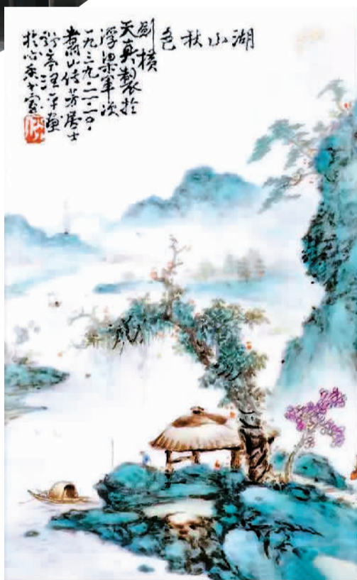
汪野亭：湖山秋色（粉彩瓷板）