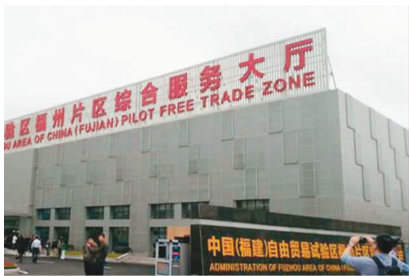
福建自贸区福州片区综合服务大厅