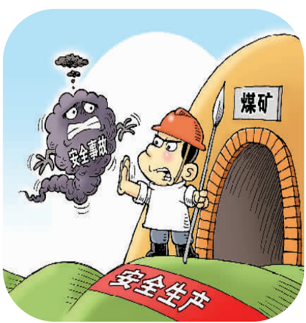
▲ 红线 徐 骏作（新华社发）

此外，《意见》还提出将职业病防治纳入各级政府民生工程及安全生产工作考核体系，制定职业病防治中长期规划，实施职业健康促进计划。