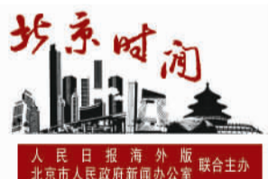
人民日报海外版 北京市人民政府新闻办公室 联合主办

专家认为，患者先在社区就诊，遇到疑难问题，社区团队医生再依据病情向三级医院转诊患者。这种转诊服务，不仅方便患者，而且避免了浪费优质专家资源。同时，将医疗专家团队资源垂直预留在社区，大大强化了增加了社区医院的功能。将社区医院升级为慢病治疗干预和家庭医生等医疗卫生政策的落地机构，将有助于市民在家门口实现便捷、精准就医。