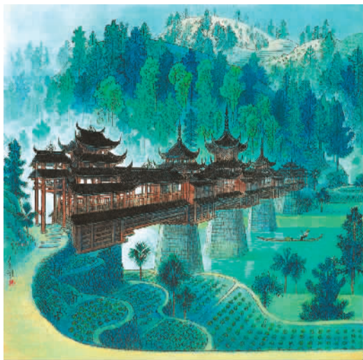
程阳风雨桥 周令钊

“美丽南方·广西——中国美术作品展”日前在中国美术馆举行，展览展出了从20世纪初至今，几代美术家所创作的广西少数民族题材的美术作品共380件。