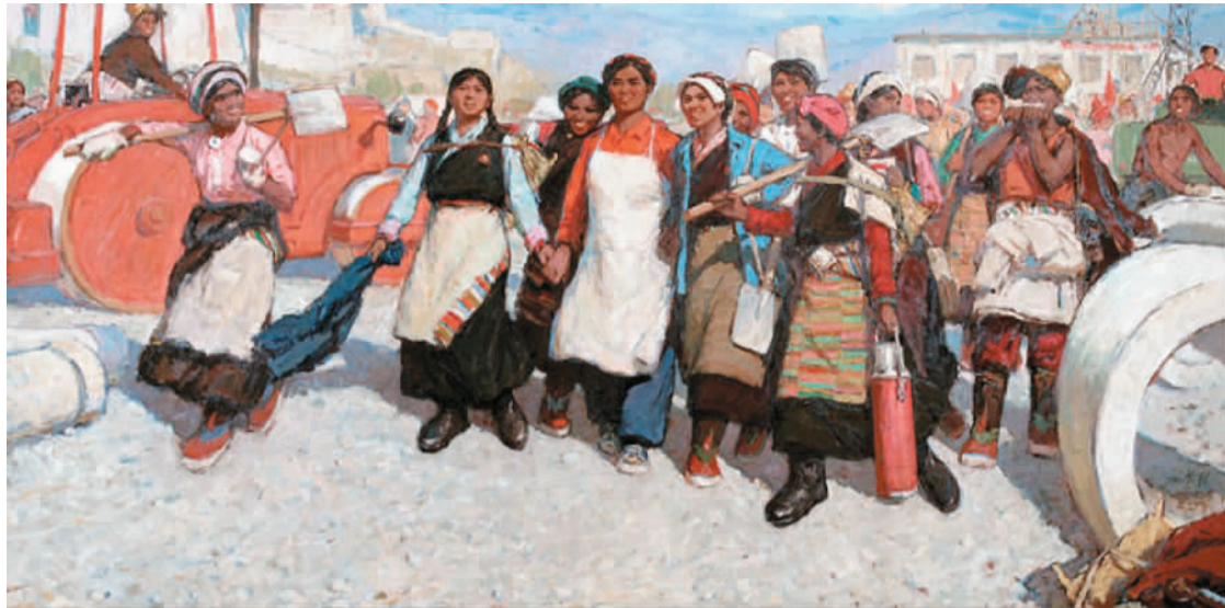
我们走在大路上 潘世勳

据悉，“行者无疆——杜滋龄中国画作品展”全国巡展已先后在广东美术馆、山东美术馆、浙江美术馆展出。至此，全国巡展也在北京中国美术馆正式收官。