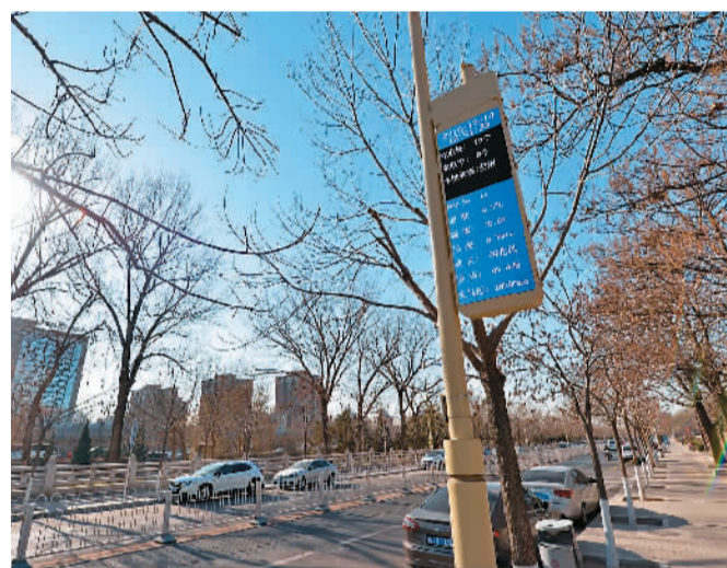
12月14日,20根复合型路灯灯杆亮相北京左安门西街,其中18根具备电动汽车充电桩功能,另外2根具备视频监控、wifi基站、信息发布等多种功能。据了解,未来在北京城六区试点路段将完成100根这样的复合型路灯杆建设。