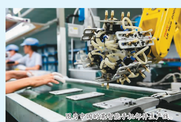
图为中国的智能手机部件生产线。

尽管欧美等国拒绝承认中国的市场经济地位,中国也不会对其转入公开的贸易战,更不会引发世界贸易战,而是会寻求通过WTO争端解决机制来解决。