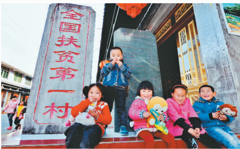
几名小朋友在福建省宁德市赤溪村村头玩耍。