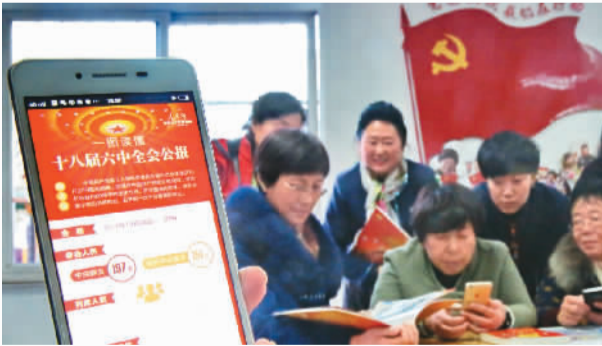
11月23日，河北省秦皇岛市海港区燕海里社区居民在“红色图书馆”内学习十八届六中全会精神。

值得一提的是，对于全面建成小康社会意义重大的脱贫攻坚战稳扎稳打。脱贫攻坚是如期实现全面小康的最大短板，党中央对打赢脱贫攻坚战的决心之大、力度之大，前所未有。十八大后不久，习近平总书记便去河北阜平考察扶贫工作，2015年先后到云南、陕西、贵州调研考察扶贫工作，在延安