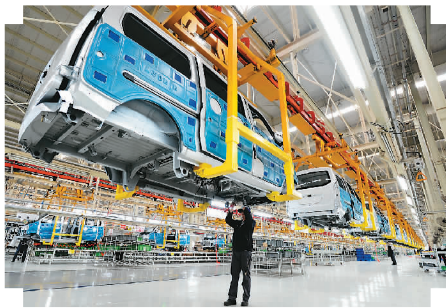
图为工人在北汽集团河北黄骅分公司总装车间生产线上工作。