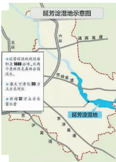
焦剑制图

按照规划，延芳淀湿地建成后，不仅可供游客观赏游玩，还将成为北运河上重要的净化器和蓄洪池。