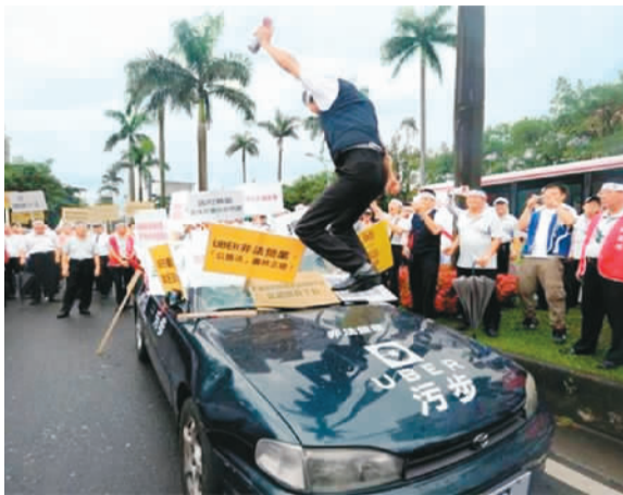
图为台湾出租车行业抗议优步“违法营运”。（资料图片）

少。比如有优步车辆绕远路多收钱，交通部门却无法介入纠纷；优步司机不需持有职业牌照；优步特意将消费者收到的车辆相关资讯车牌号码删减到只留2个数字，更增加追责难度，等等。