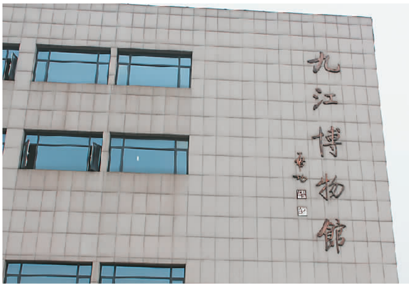
启功题写的九江博物馆馆名