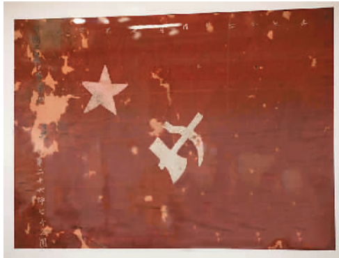
国家博物馆展出的镰刀斧头旗

当参观到“净土仙踪”部分时，历史在这里似乎静下来了，呈现眼前的是另一方天地。以“神仙之庐，宗教之山”而闻名的庐山，周围聚集了众多的僧院道坛。宗教与世俗的对话，留下道不尽的秘事禅语。