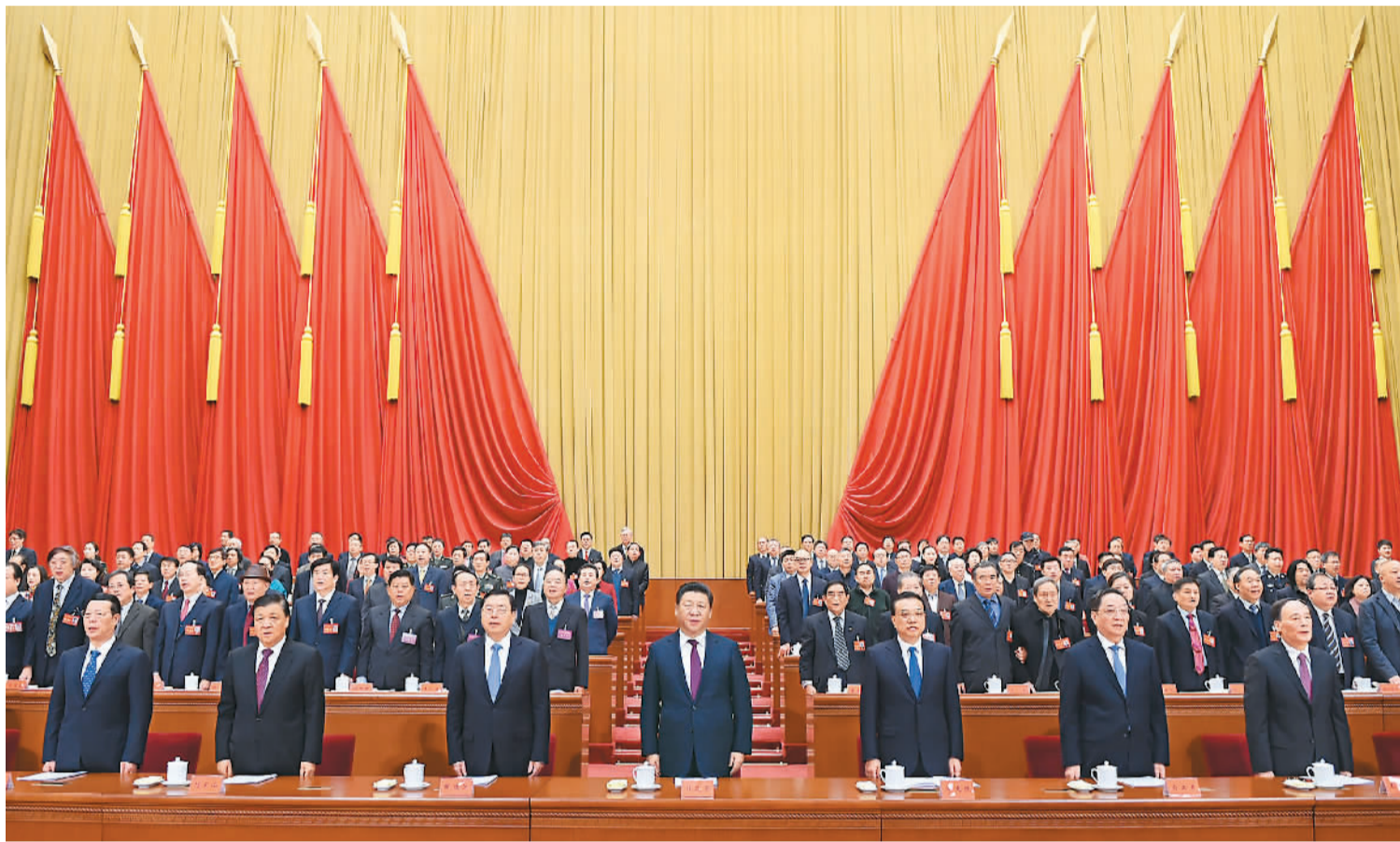
党和国家领导人习近平、李克强、张德江、俞正声、刘云山、王岐山、张高丽等出席大会。