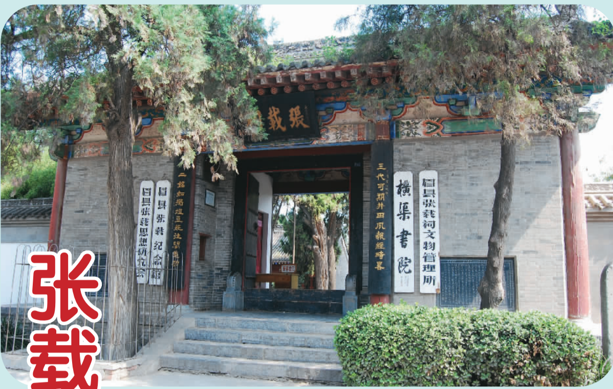
张载祠位于陕西省宝鸡市眉县县城东26公里处，静谧而厚重地驻居在街巷一隅。

51岁时，因对王安石新政变法有看法，张载辞官回到横渠镇，依靠家中薄田生活，在少时读书的崇寿院讲学读书，“俯而读，仰而思。有得则识之，或半坐起，取烛以书……”在此期间，他写下了大量