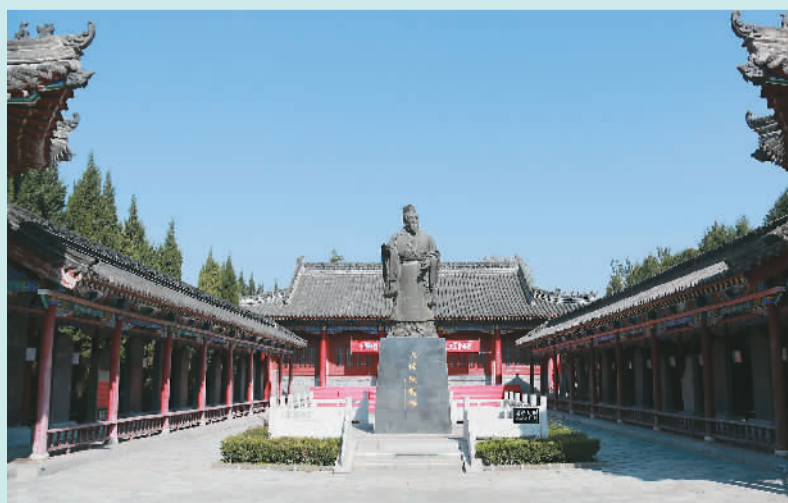
张载辞世后，后人为了纪念他，将他常年讲学的崇寿院改名为横渠书院，后辈尊称张载为“横渠先生张夫子”。

张载的一生，两被召晋，三历外仕，著书立说，终身清贫。在张载祠南7公里处的大镇谷迷狐岭，