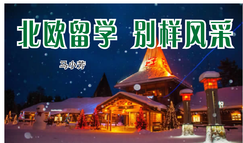
图为芬兰的圣诞老人村。

北欧国家包括丹麦、瑞典、挪威、芬兰、冰岛。提起这些国家，大部分人想到的是漫长的冬季、绚丽的极光、维京人和他们的北欧神话。那么，在北欧留学会是一种怎样的体验呢？