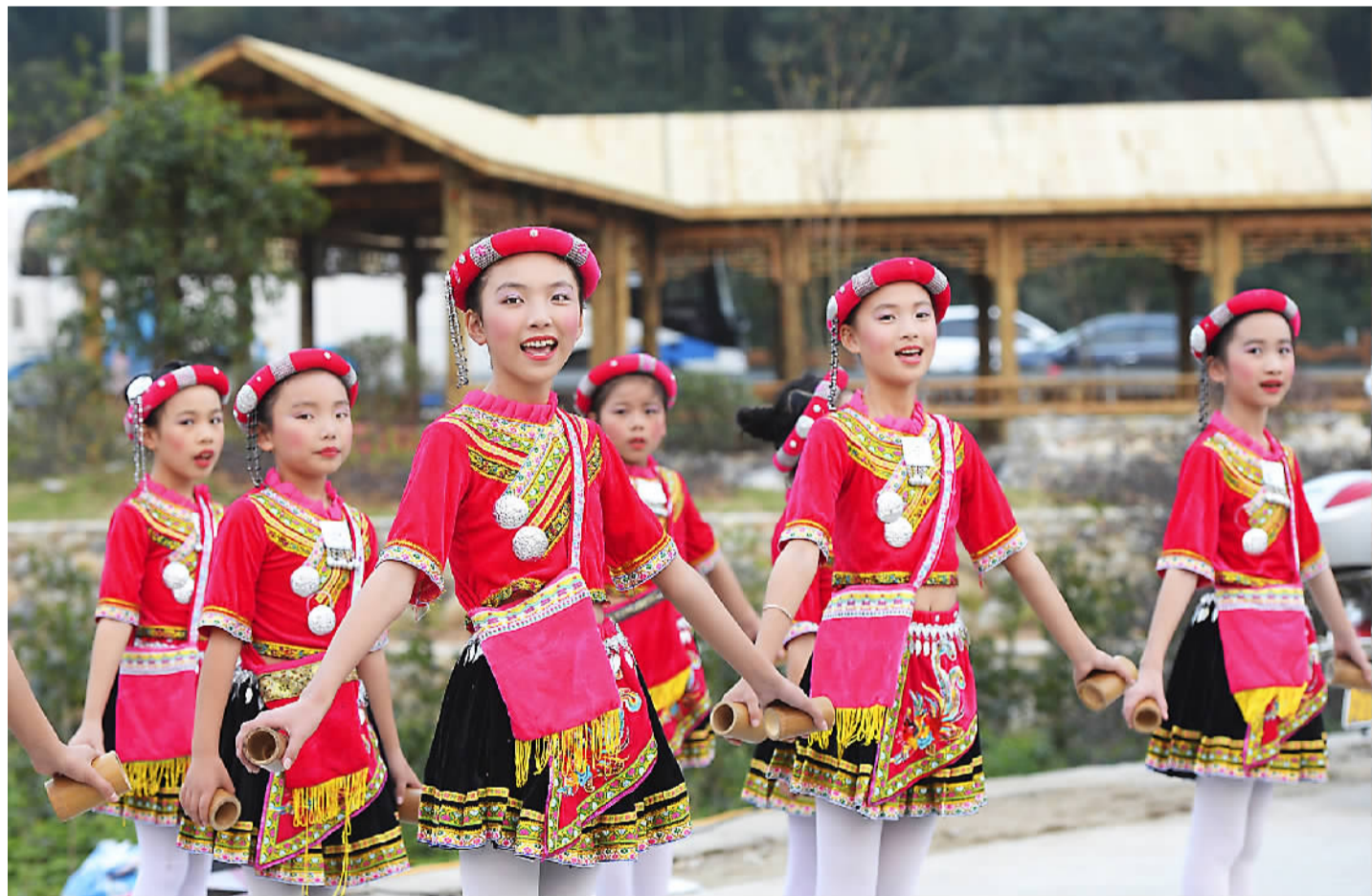
近年来，福建省福鼎市赤溪村坚持“生态立市、旅游富村”的脱贫致富路，先后被列入全国少数民族特色村寨试点村、全国旅游扶贫试点村、中国乡村旅游模范村、中国最美休闲乡村等，2015年，全村农民人均收入13649元，村集体收入32万元，实现了旅游富村。图为当地小学生在展示畲族歌舞。