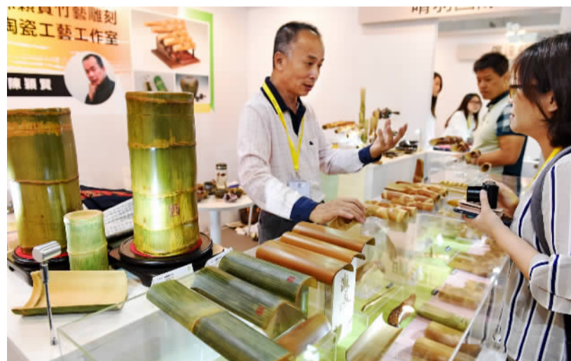
来自台湾的参展商(左)在展会上向客人介绍竹雕工艺品。

参与“艺术设计奖”、“产学研项目对接会”等活动。大陆12家最具代表性的博物馆、两岸80个文创旅游城市及景区等企业与台湾五大文创协会、百家设计名企一起,共同开拓两岸IP设计合作的新局面。