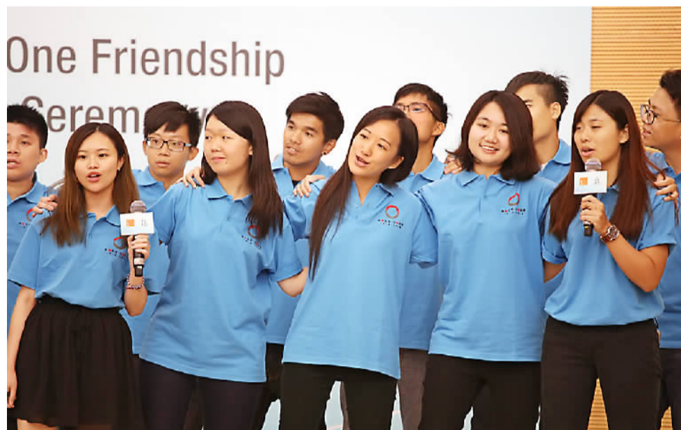
青年献唱“一带一路”友谊计划主题曲。

据悉，当天的讲座由香港知名青少年交流团体未来之星同学会主办。讲座会以在线自由报名的方式面向全港公开招募学生听众，近500名香港