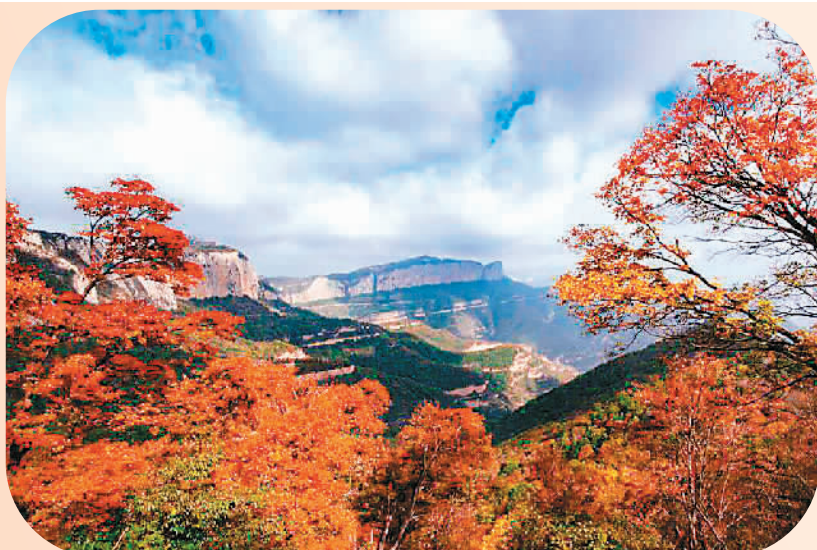
10月下旬在山西省黎城拍摄的大行山秋色。