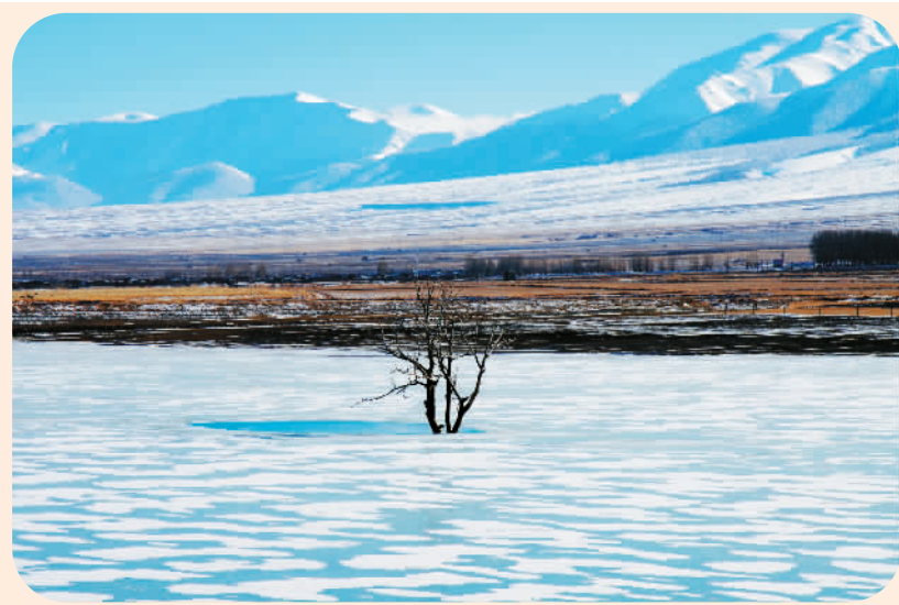
11月7日拍摄的新疆巴里坤哈萨克自治县雪景。