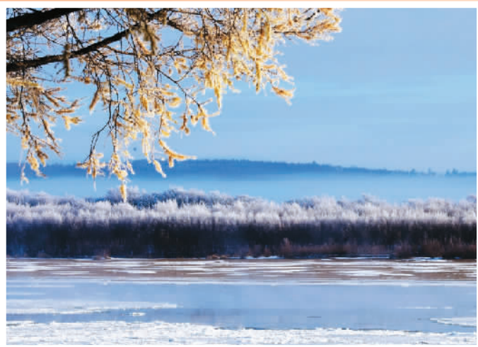
▲10月22日，在黑龙江呼玛江段拍摄的雾凇景色。