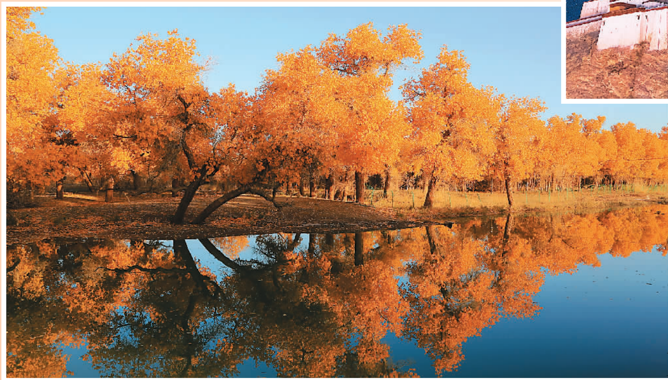
▲10月19日，位于内蒙古阿拉善盟额济纳旗黄灿灿的胡杨林，呈现出梦幻般的金黄色。