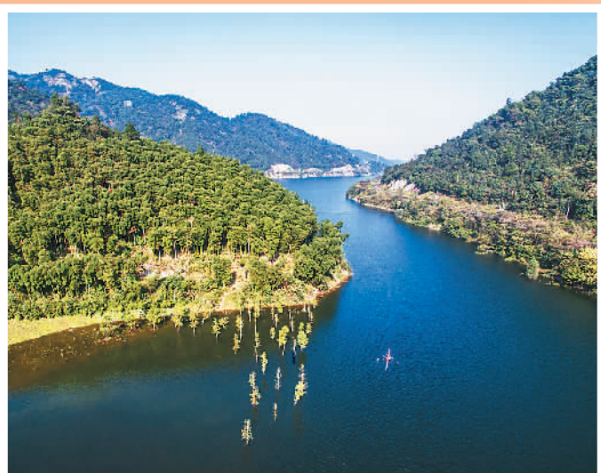
▲11月3日，俯瞰浙江安吉县凤凰湖生态景观湿地。