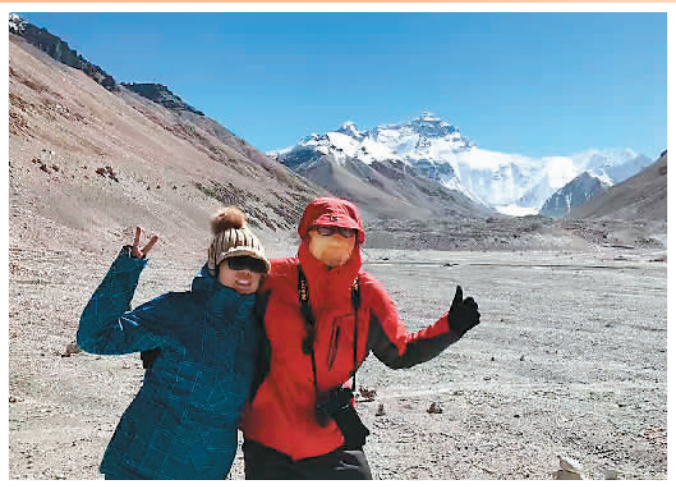
▲11月4日，游客在西藏自治区珠峰大本营同远处的珠穆朗玛峰合影。