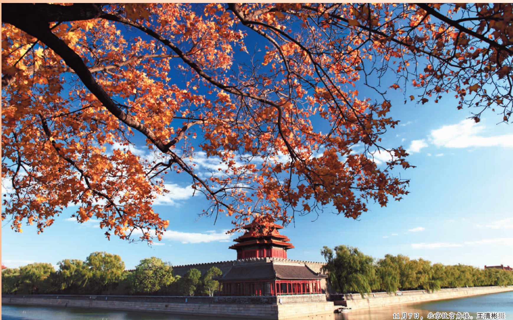
11月7日，北京故宫角楼。