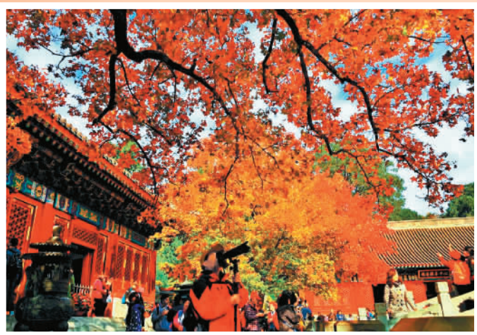
▲10月23日，北京香山公园勤政殿前的两株元宝枫呈现出最佳观赏效果。