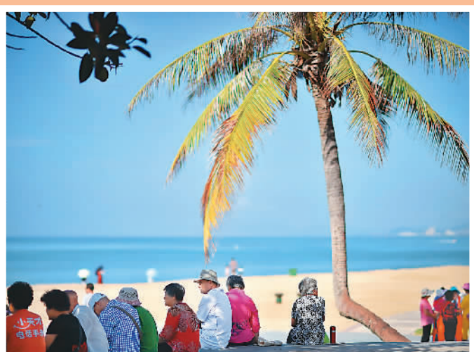
▲10月28日，游客在海南三亚湾晒太阳。