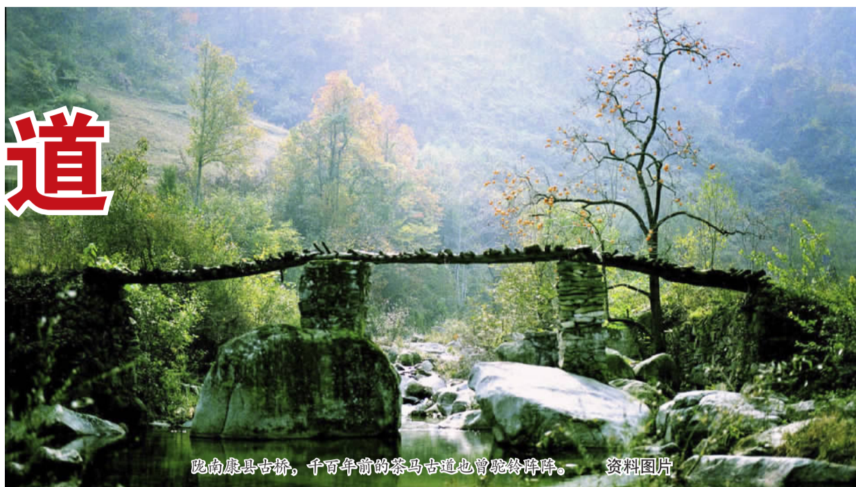
陇南康县古桥，千年前的茶马古道也曾驼铃阵阵。 资料图片

壮美的自然风光，神秘的文化遗产。说起茶马古道，人们都会想到云南、贵州、四川等西南地区的历史文化遗存。可鲜有人知道，在甘肃西北地区，也有一条古老而悠久的商贸古道。它记载着上千年飘摇动荡的岁月，烙印着风雨无阻的步步脚印，见证着西行远去的阵阵马蹄。