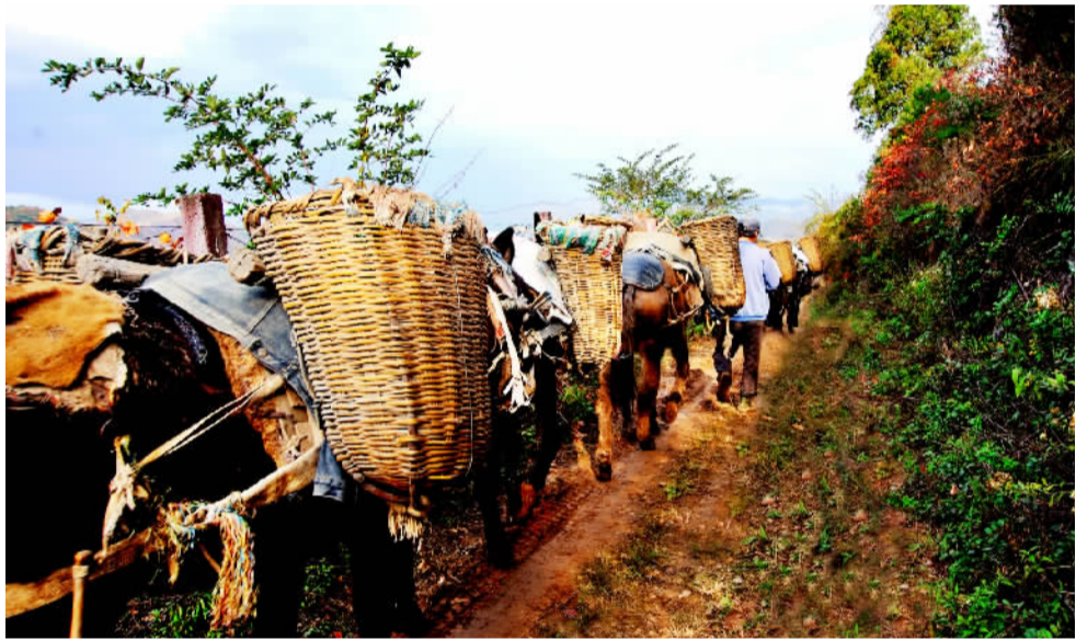
在如今的陇南各县山区，经常还能见到马帮。 资料图片

“犹闻山中马帮来”。作为两千年的智慧结晶，北茶马古道凝聚了陇南康县地区多民族、多文化的人文底蕴，为这片青山绿水增添了历史积淀与蓬勃生机并存的美丽。从商贸流通的古道，到如今的陇南新城，这片注定不平凡的土地，将散发更加灿烂的光芒。