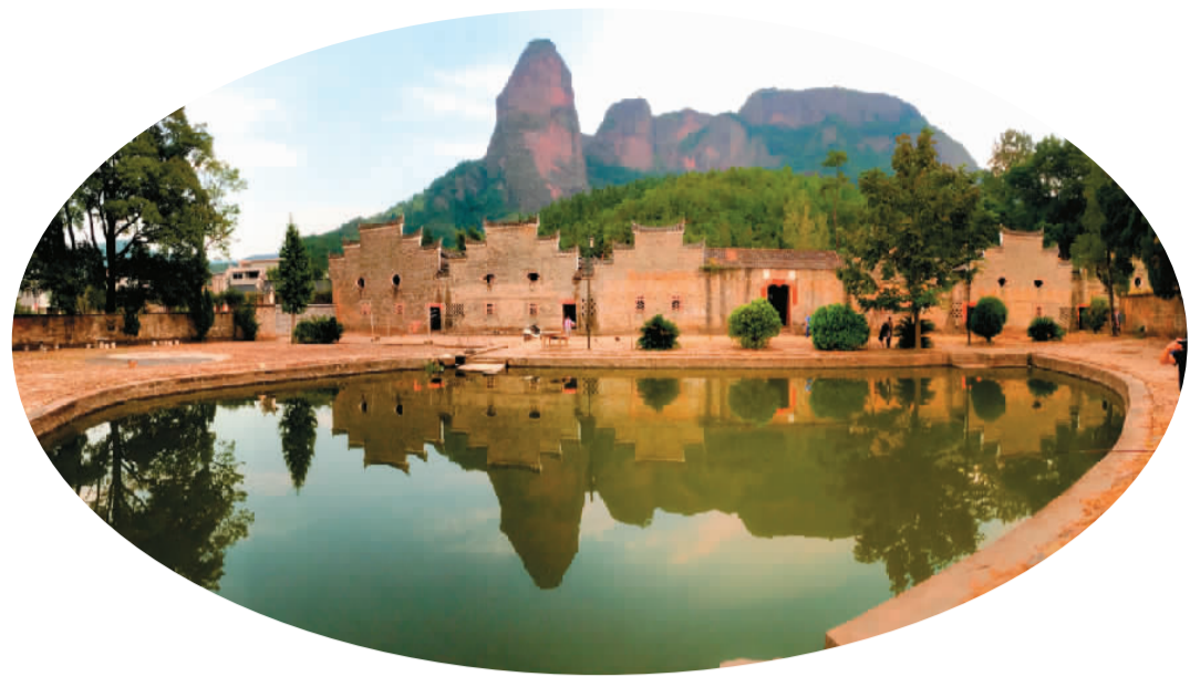
江西前江小流域生态文明新村。

如今的中华大地已披上了金黄的秋装，汨汨清溪流汇成碧波万顷，波上寒烟凝翠，山映斜阳，落霞满地，秋水共长天一色。