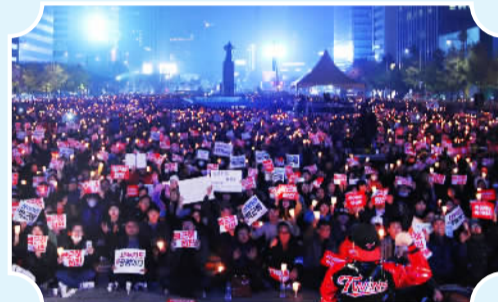
图为11月5日,韩国民众参加要求总统朴槿惠下台的烛光集会。