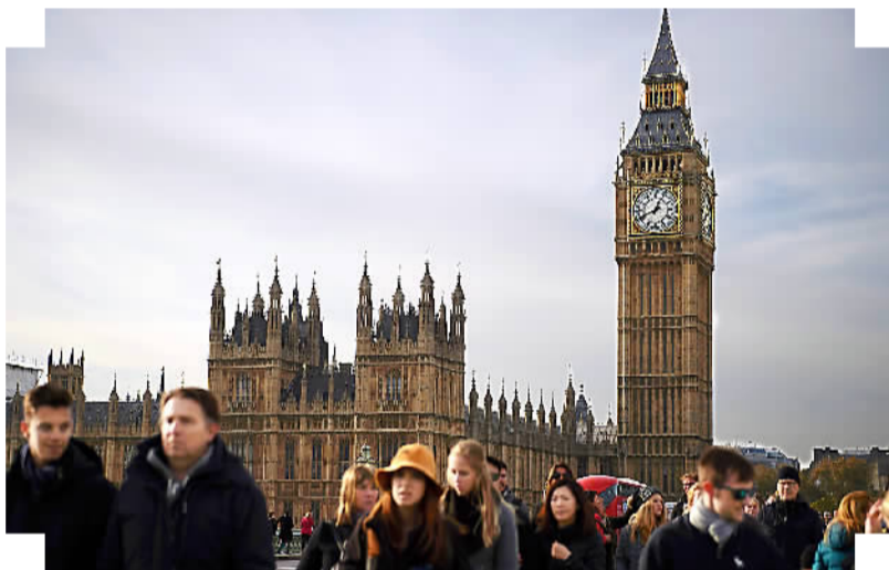
图为11月3日,在英国首都伦敦,人们从议会大厦前走过。

受影响的不仅仅是英国。作为“脱欧”谈判的另一方,欧盟虽然无法对英国国内的政治法律问题插手太多,但这样的横生枝节显然是其不愿看到的。专家指