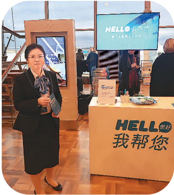
芬兰赫尔辛基机场的中文服务柜台。

安徒生故乡丹麦菲英岛欧登塞近年来深受中国游客青睐。“沿着安徒生的足迹”作为欧登塞最重要的旅游项目受到中国游客喜爱。游客可以沿着市中心真人大小的安徒生足迹探索安徒生的童年故居、了解他经典作品的灵感来源。