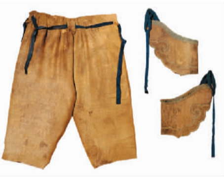
元纳石失靴套（右）、六出地格力芬花纹绫裤

香港理工大学姜绍祥教授的一件丝绸服装作品，取名“四两十钱”，专家向记者介绍说，这件服装整体重量250克，换算成中国计量单位为5两，它用纳米金属材料进行镀膜，由于采用合金材料，凭借良好的反射能力，面料在不同环境、光线下可呈现不同色彩效果，并具有防水、抗静电的效果。该作品设计风格独特，可经过不同搭配组合后呈现5种穿法。这件服装展览后将捐赠给丝绸博物馆，成为馆藏的又一件珍品。收集今天，为了明天。中国丝绸博物馆通