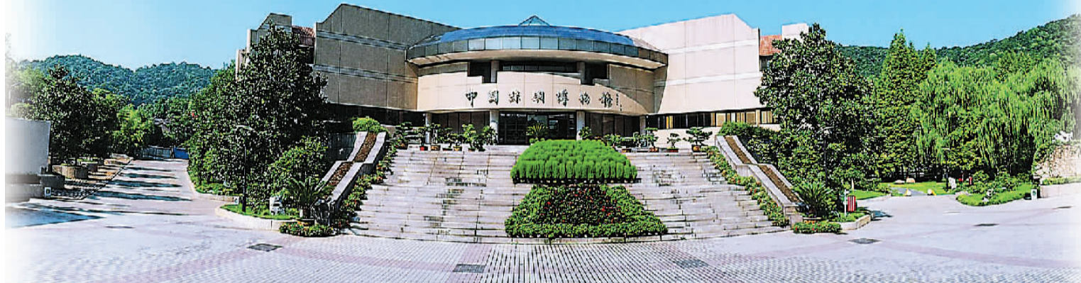
中国丝绸博物馆大门