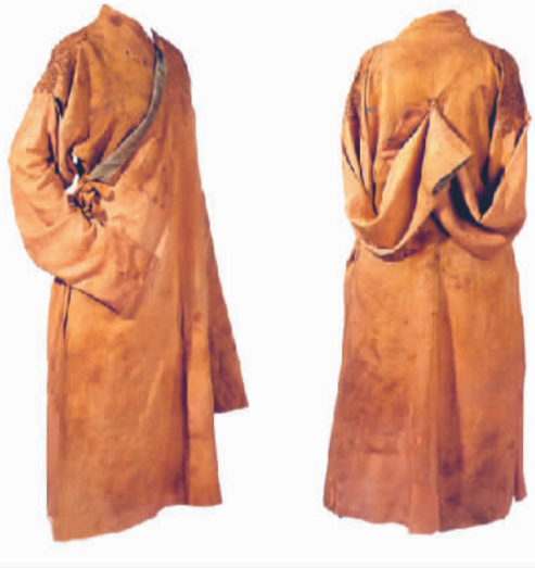
元代菱地飞鸟纹绫青衣

煌历史。由钱山漾漂出的这根纤纤蚕丝，重新勾起了人们对这一华夏远古文明的敬仰，并源源不断地诉说着“湖丝遍天下”的盛况。