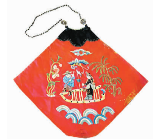
清末红缎地彩绣肚兜