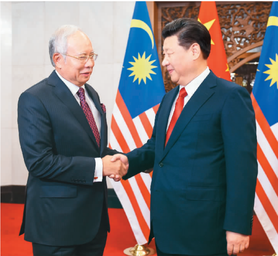
11月3日,国家主席习近平在北京钓鱼台国宾馆会见马来西亚总理纳吉布。

本报北京11月3日电 (记者杜一菲) 国家主席习近平3日在钓鱼台国宾馆会见马来西亚总理纳吉布。习近平指出,中马是隔海相望的近