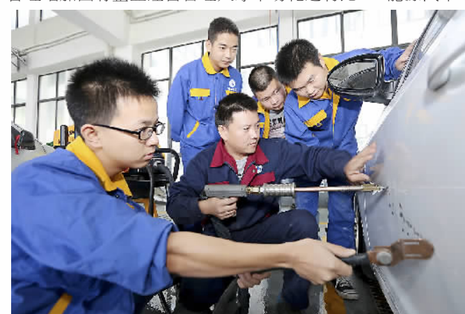
10月18日，在湖北襄阳汽车职业技术学院实训中心，“现代学徒制校企合作班”的学生正在接受汽车后市场方面培训。

湖北省，尤其武汉市，高校众多。为深化高校创新创业教育改革，湖北建立“荆楚卓越人才”协同育人机制，引导行业、企业和用人单位全程参与高校人才培养。