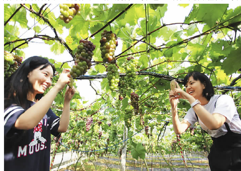
四川遂宁引导人才返乡创业，使撂荒地变身葡萄园，发展生态观光农业。