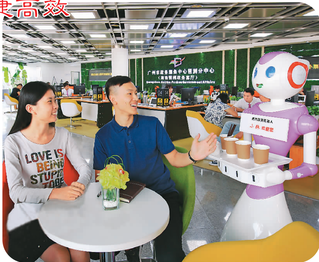
广州市政务服务中心琶洲分中心