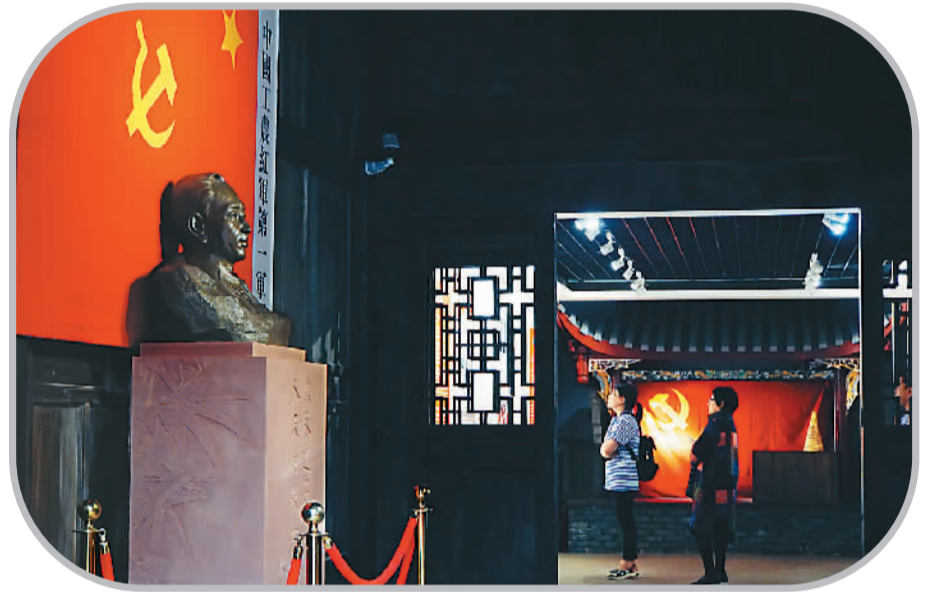
耿飚将军纪念馆内游客在认真观展