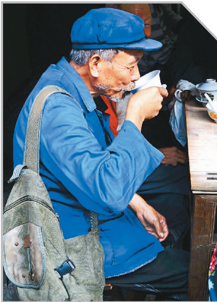
古镇小茶馆是老人劳作后每天必去光顾的地方