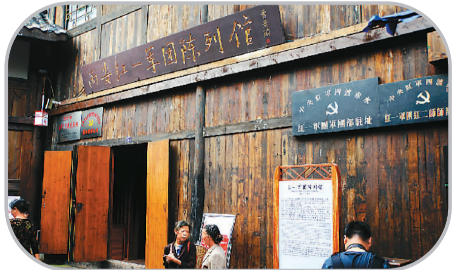
红一军团指挥部旧址坐落在古城的主街道上