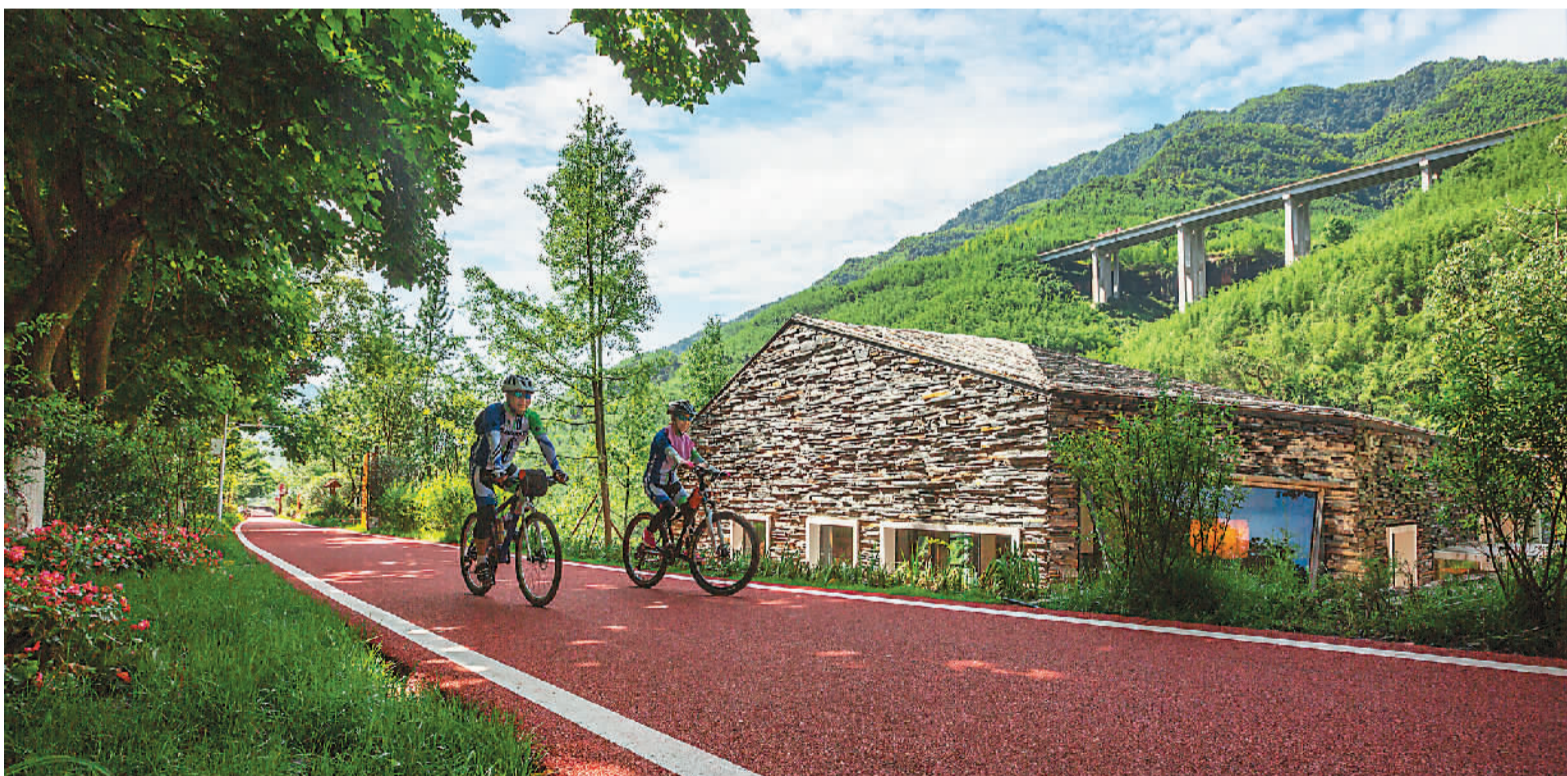
人们在赤水绿道塑胶旅游公路上骑行