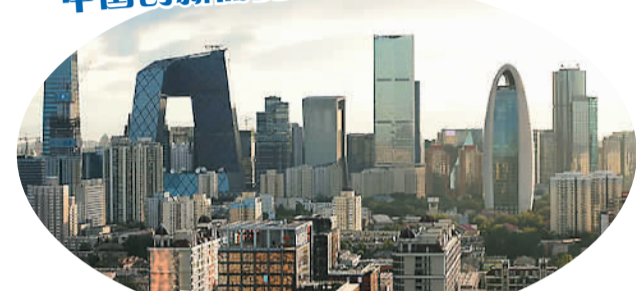
英国《金融时报》：中国“新经济”生机勃勃

中国的重大结构性转变依然以老工业基地去产能为主，但与此同时，一系列较小却重要的转变正合力打造一个由技术、互联网和大约4.15亿千禧一代的消费选择推动的生机勃勃的“新经济”。