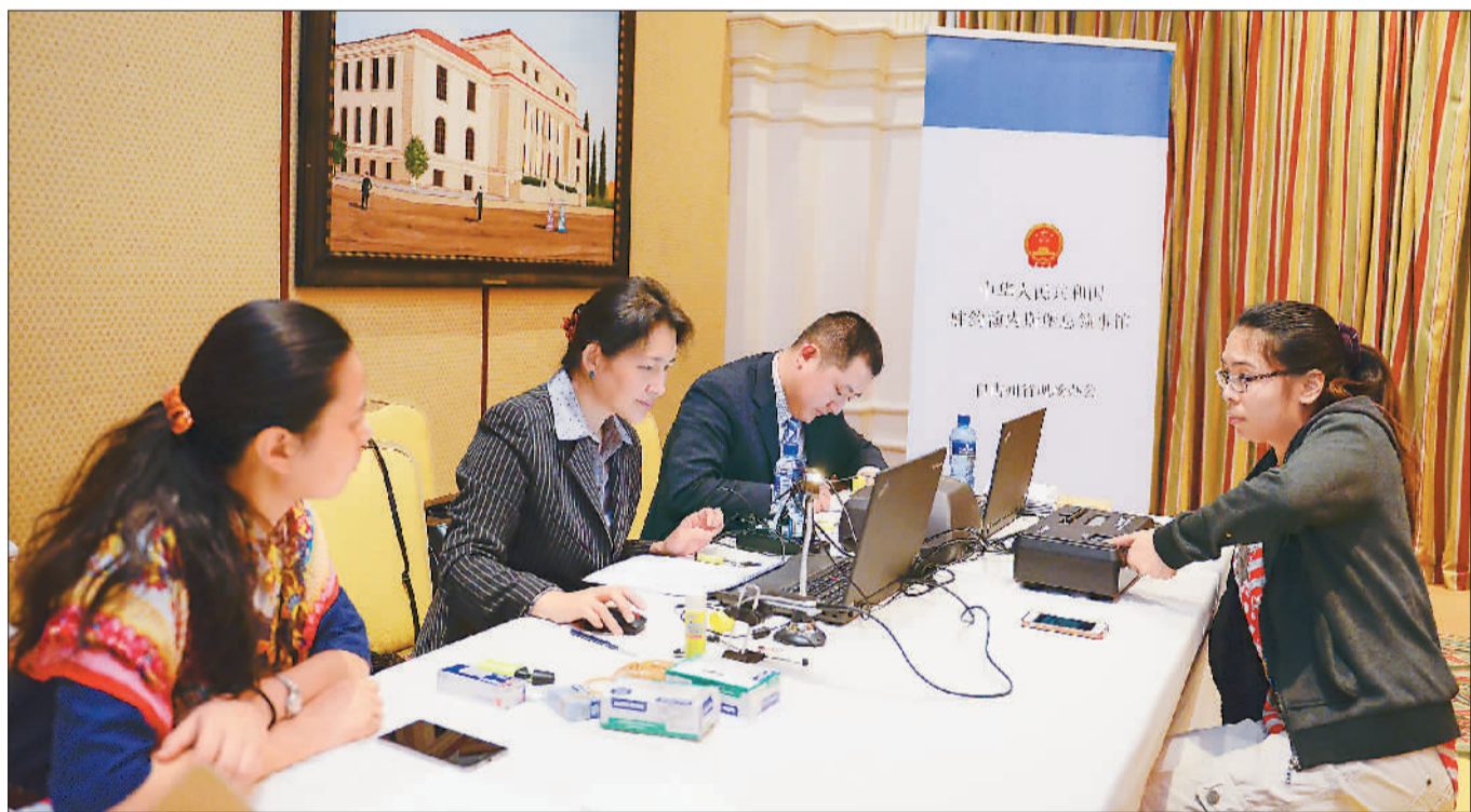
中国驻约翰内斯堡总领馆工作人员近日分赴南非自由州省布隆方丹市及哈里史密斯市,为当地华侨办理领事证件业务。图为工作人员在办理业务。