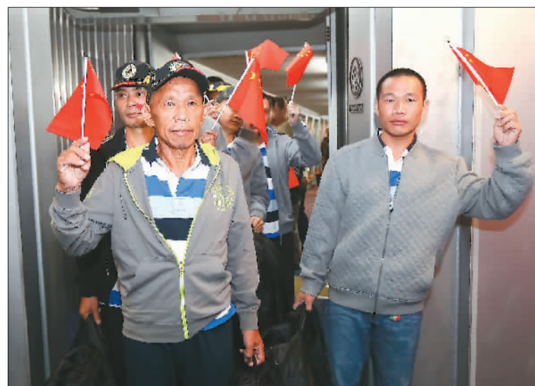
10月25日5时多,9名遭索马里海盗绑架后获救的中国同胞安全抵达广州白云国际机场。外交部工作组在白云机场举行了简短的欢迎仪式。图为获救回国的中国船员。