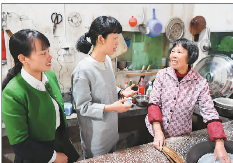
▲ 图为10月13日,福建省寿宁县“中帼信访服务队”队员到村民家回访信访件办结情况。

问:根据《办法》,各级党政机关领导干部要在信访中如何落实责任? 答:首先,《办法》首次对信访工作各责任主体的责任内容进行明确规定,解决了工作实践中理解不一、难以界定和把握不准的问题。其次,对信访工作督查的主体、内容、频率和程序作出具体规定,要求各级党政机关每年至少就信访工作开展